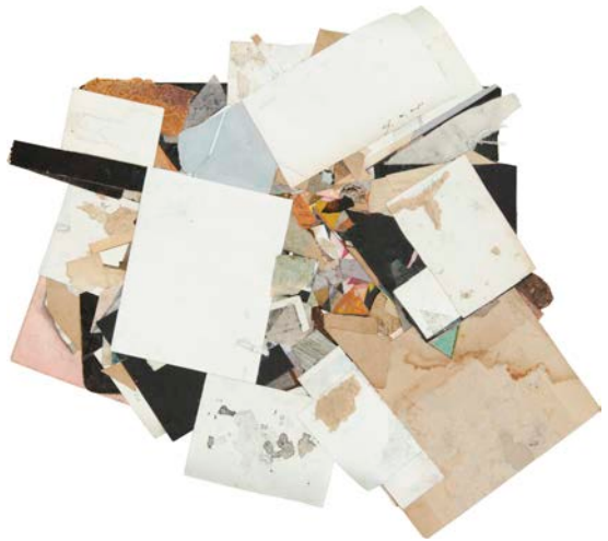
Untitled (2014) Hans Andersson 42x43 cm mixed media