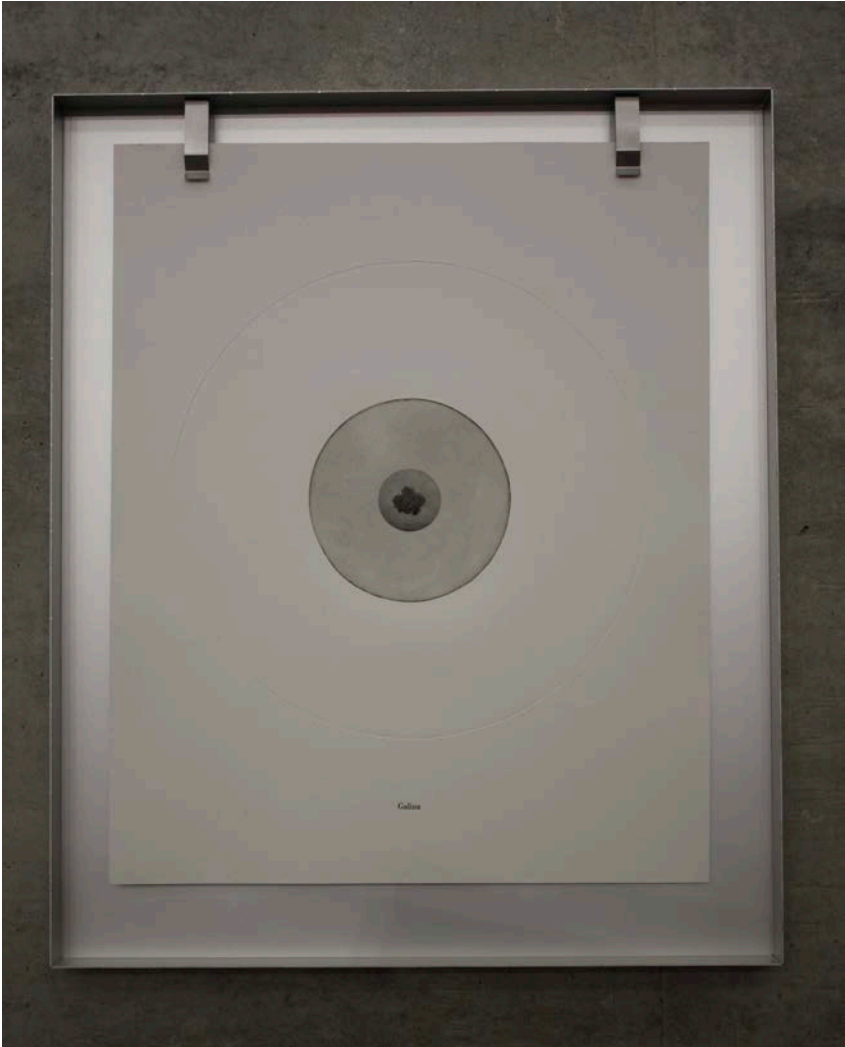
The Undistorted Image of Galina (2013) Arijana Kajfes