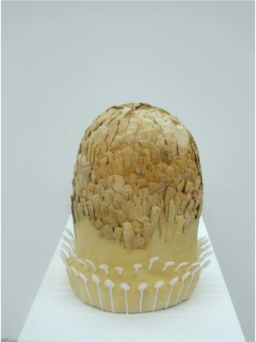
Den, Den Den (2013) Eva Löfdahl 39x54x39 cm Trä, papier mache, plast